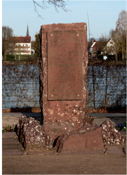
Stèle en contrebas du pont de l'Europe.

De nombreux membres furent arrêtés puis assassinés. Ce fut le cas de 29 membres du réseau emprisonnés le long de la frontière allemande et fusillés entre le 23 et le 29 novembre 1944. Leurs corps ont ensuite été jetés dans le Rhin. Au total, plus de 1000 membres du réseau ont été arrêtés et 432 d'entre eux perdirent la vie.